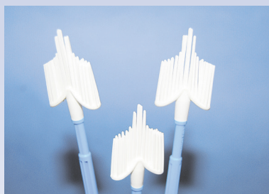
Program profilaktyki raka szyjki macicy