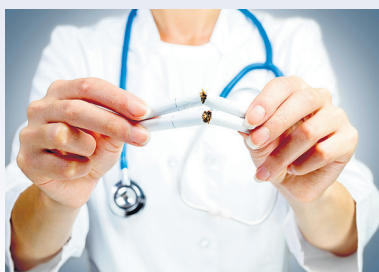
Program profilaktyki chorób odtytoniowych