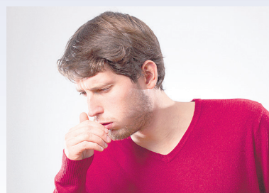
Program profilaktyki gruźlicy