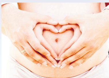
Program badań prenatalnych