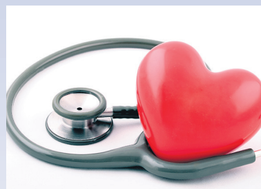
Program profilaktyki chorób układu krążenia